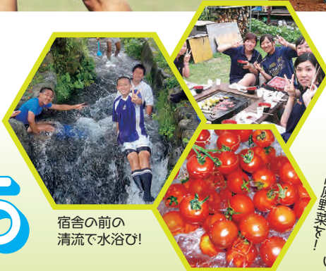
宿舎の前の 清流で水浴び!