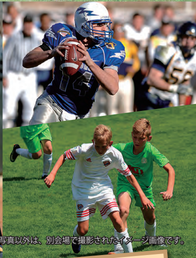
アーチェリーの写真以外は、別会場で撮影されたイメージ画像です。